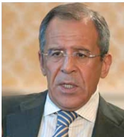
Сергей Лавров, министр иностранных дел Российской Федерации

В 1994–2004 гг. Сергей Лавров являлся постоянным представителем Российской Федерации при ООН.