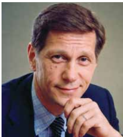
Александр Жуков, первый заместитель председателя Государственной думы РФ

Депутат Государственной думы первого, второго, третьего, четвертого и шестого созывов. В Думе второго и третьего созывов – председатель Комитета по бюджету и налогам. В Думе четвертого и шестого созывов – первый заместитель председателя Государственной думы. Член бюро высшего совета партии «Единая Россия».