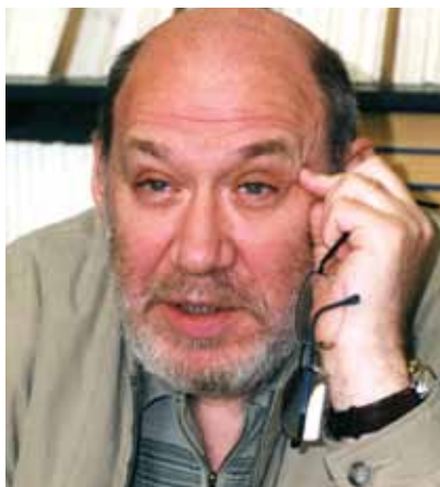
Георгий Сатаров, президент Регионального общественного фонда «Информатика для демократии» (фонд «ИНДЕМ»)

До избрания президентом фонда «ИНДЕМ» в 1997 г. Георгий Сатаров являлся помощником президента Российской Федерации.