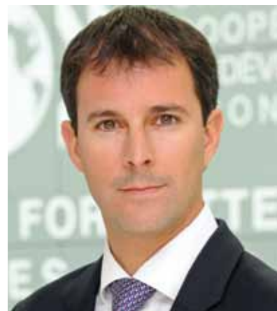
Гектор Леуэде, старший аналитик по вопросам экономической политики Дирекции финансовых отношений и предпринимательства Организации экономического сотрудничества и развития (ОЭСР)

Отмечен государственными наградами. Окончил Московский государственный институт международных отношений МИД СССР.