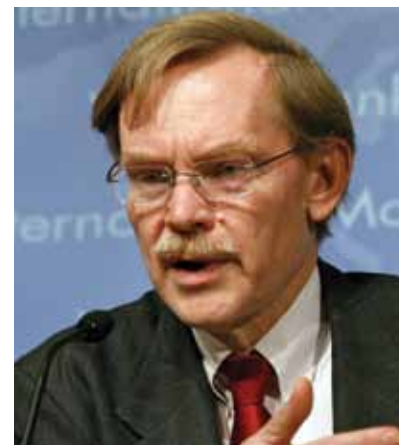
Роберт Б. Зеллик, президент Группы Всемирного банка

Окончил экономический факультет Московского государственного университета им. М.В. Ломоносова. Имеет диплом Международной школы бизнеса Гарвардского университета.