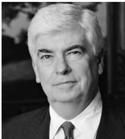
Кристофер Джон Додд, бывший сенатор и председатель банковского комитета Сената США

Крис Додд в настоящее время занимает пост председателя и генерального директора Motion Picture Association of America, Inc.