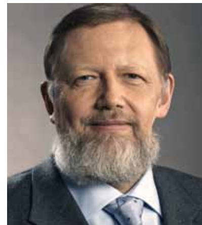
Сергей Дубинин, председатель Наблюдательного совета банка ВТБ, член совета директоров «ВТБ Капитал»

В 2007 г. сенатор Додд боролся за право выдвижения своей кандидатуры на выборах президента США от Демократической партии.