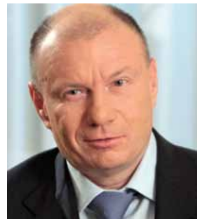
Владимир Потанин, председатель Национального совета по корпоративному управлению, президент компании «Интеррос»