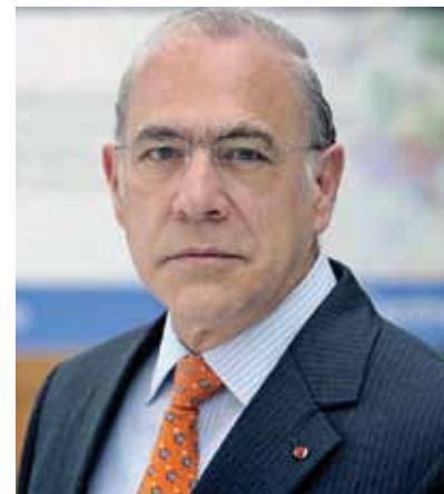
Анхель Гурриа, генеральный секретарь Организации экономического сотрудничества и развития (ОЭСР)

Окончил Московский физико-технический институт в 1993 г. Стажировался на факультете экономики Массачусетского технологического института, преподавал в Принстонском университете. Доктор экономических наук.