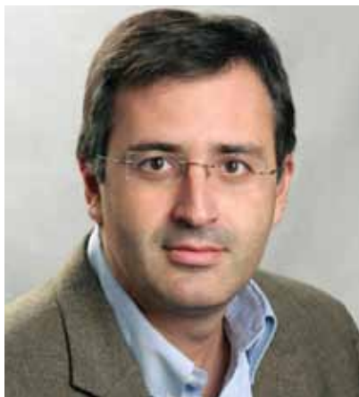
Сергей Гуриев, ректор Российской экономической школы

С 1998 г. работает в Российской экономической школе, с 2004 г. – в должности ректора. Работы Сергея Гуриева опубликованы в российских и международных научных изданиях, включая American Economic Review , American Political Science Review , Journal of European Economic Association и др.