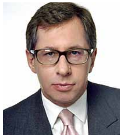
Петр Авен, председатель совета директоров банковской группы «Альфа-Банк», член совета директоров

В 1994–2011 гг. Петр Авен занимал должность президента «Альфа-Банка». Отвечал за общую стратегию развития банка и поддержание связей с деловыми и правительственными кругами в России и за рубежом.