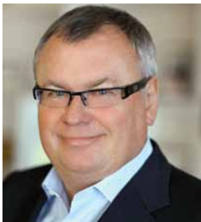
Андрей Костин, президент – председатель правления, член Наблюдательного совета банка ВТБ

В 1996–2002 гг. Андрей Костин возглавлял Внешэкономбанк.