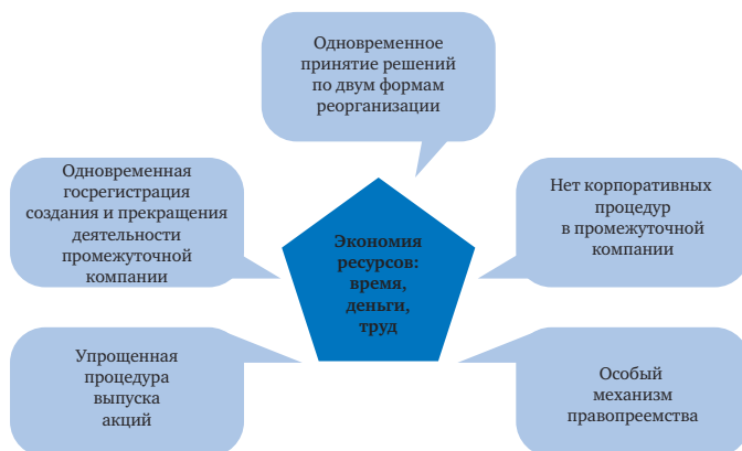
Рис. 13. Особенности совмещенной реорганизации

Основные юридические особенности совмещенной реорганизации заключаются в следующем (рис. 13).