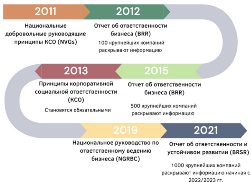
Рисунок 5. Основные правила раскрытия ESG-отчетности для крупнейших компаний Индии.

10 мая 2021 года Совет по ценным бумагам и биржам Индии выпустил циркуляр, [25] который вводит новые требования к отчетности, связанной с устойчивым развитием и ESG. Под нормы данного документа попадают 1000 крупнейших компаний страны по рыночной капитализации. Таким образом, с 2023 года компании должны будут в обязательном порядке раскрывать информацию согласно новым требованиям в формате “Отчета об ответственности и устойчивом развитии (BRSR)”. Данный формат отчета имеет существенные отличия от уже существующего “Отчета о деловой ответственности (BRR)”, в рамках которого уже раскрывают информацию 500 крупнейших компаний по рыночной капитализации. Совет по ценным бумагам и биржам Индии стремится к приведению отчетности по устойчивому развитию в соответствии с существующими международными стандартами финансовой отчетности. Следует отметить, что ещё предстоит проделать немалый объем работы по подготовке отраслевых руководств по раскрытию ESG-информации.