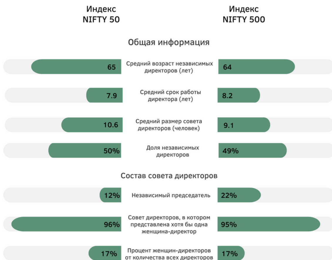
Рисунок 2. Индексы NIFTY 50 и NIFTY 500: различия в структуре и разнообразии советов директоров.*

Раздел 203 Закона “О компаниях” от 2013 года, предусматривает, что физическое лицо не может быть назначено председателем совета директоров компании и генеральным директором одновременно, если уставом компании не предусмотрено иное или компания не занимается несколькими видами деятельности. Согласно вышеперечисленным данным отчета “Советы директоров Индии: структура и размер”, многие компании объединяют две должности - председателя совета директоров и генерального директора. Недавно Совет по ценным бумагам и биржам Индии внес изменения в “Обязательства по листингу и требования к раскрытию информации” (LODR) от 2015 года и разделил должности председателя совета директоров и генерального директора. Таким образом, начиная с 1 апреля 2022 года крупнейшие компании из индекса NIFTY 500 должны следовать новому положению и разделять должности и компетенции председателя совета директоров и генерального директора.